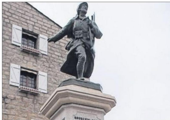
Aucun membre ne souhaitant se présenter à la tête du bureau de la section, la dissolution a été prononcée.